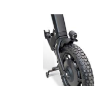
Band grof profiel