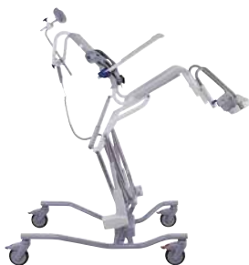
Maximale zitkanteling en maximale zithoogte