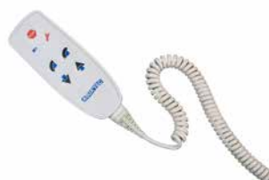
Eenvoudig te bedienen handbediening