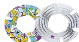
Spaakbeschermer: Comic en Sphere